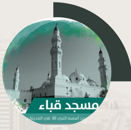
مسجد قباء 3.5 كم