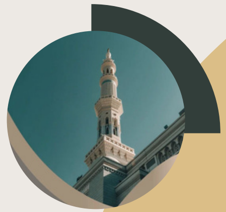
المسجد النبوي الشريف 6 كم