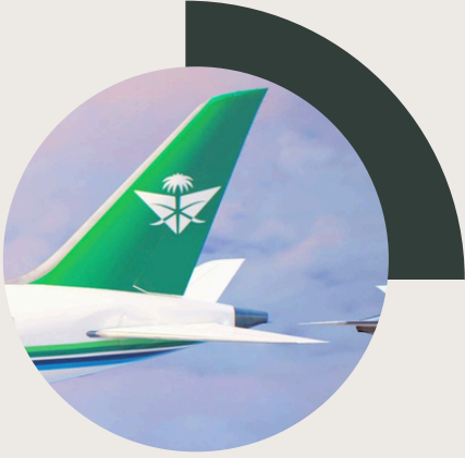
مطار الأمير محمد بن عبد العزيز 18 كم