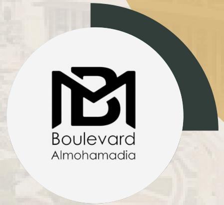
بوليفارد المحمدية 1 كم