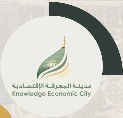
مدينة المعرفة الاقتصادية 10 كم