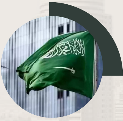
الدوائر الحكومية 2 كم