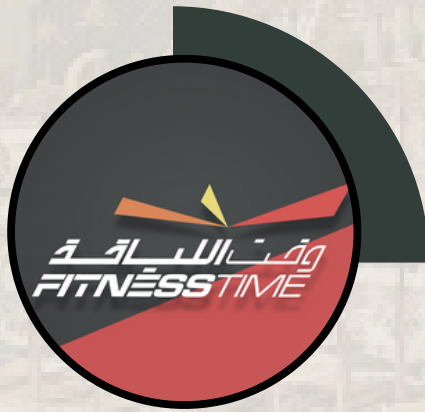
وقت اللياقة 1 كم