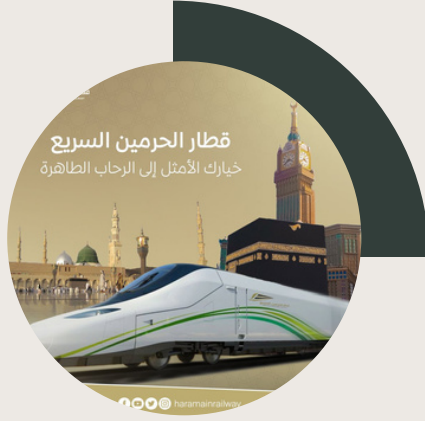
قطار الحرمين السريع خيارك الأمثل إلى الرحاب الطاهرة 11 كم