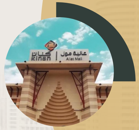
عالية مول 2.5 كم